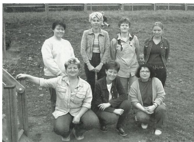
Enseignants et A.T.S.E.M. de l'école maternelle