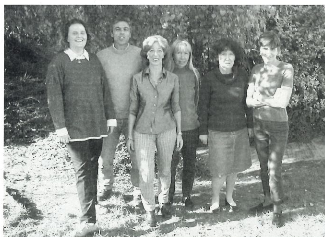
Enseignants de l'école élémentaire