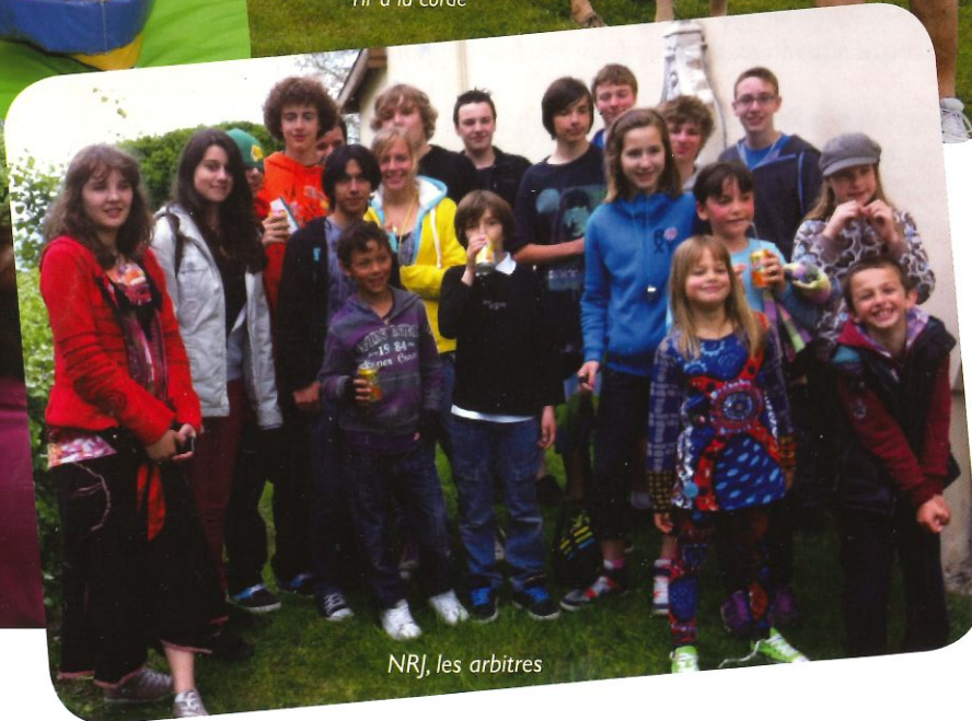
NRJ, les arbitres