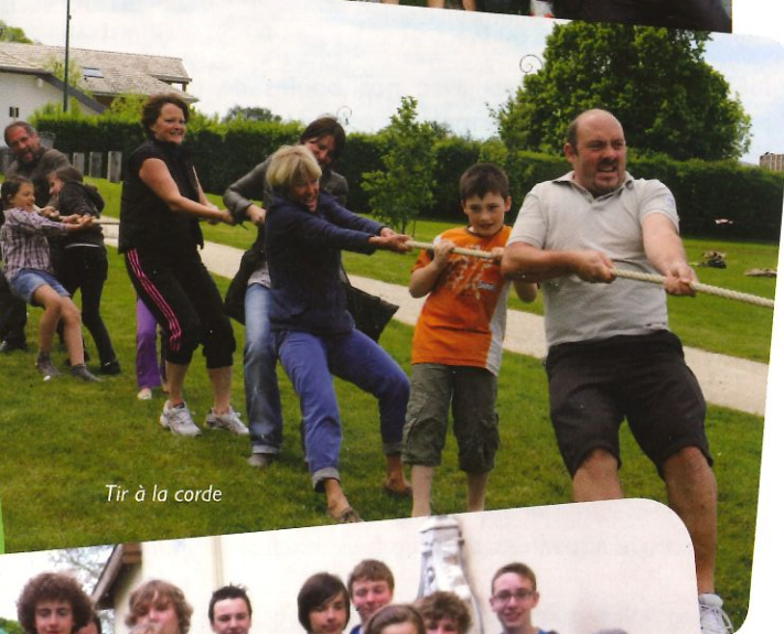
Tir à la corde