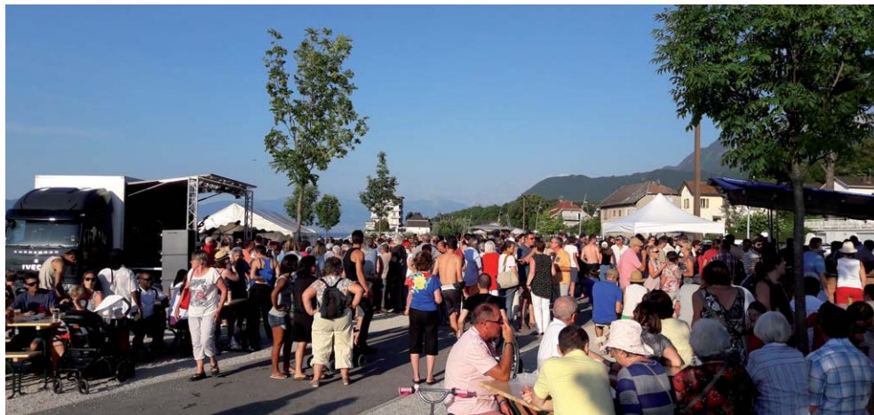
Fête de la musique 2017