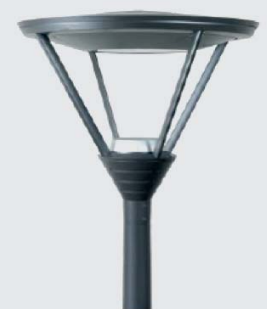
Les nouveaux luminaires qui seront installés.

Les changements de luminaires diminueront de façon très sensible la consommation énergétique tout en améliorant la qualité d'éclairement.