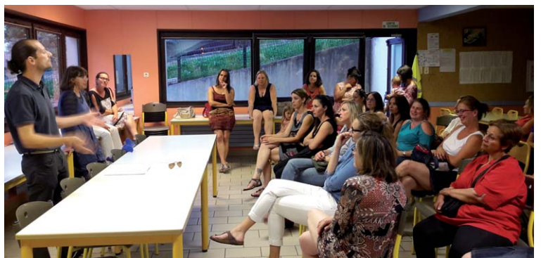
AG extraordinaire du 30 mai 2017

La Fourchette de Milly, l'association du restaurant scolaire tourne une nouvelle page de sa longue histoire : depuis plus de 30 ans, elle gère la cantine du groupe scolaire Robert MAGNIN grâce à l'investissement de parents bénévoles. Dès la rentrée de septembre 2017, les responsabilités de l'association seront allégées car la mairie prendra désormais en charge la partie repas (commande, facturation, planning des bénévoles,...) :