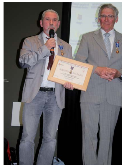
Notre nouveau médaillé et président de l'UD