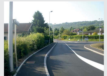
Carrefour du Banc Vert

Le chantier de sécurisation de la RD21 (avenue de Milly) s'est terminé fin mai dans les délais prévus. Les dernières finitions de balisage et de travaux paysagers seront achevées courant juin.