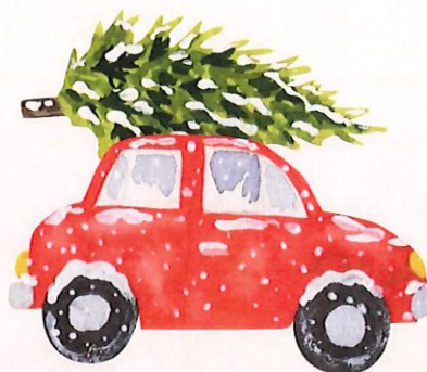
SAPIN DE NOËL

DÉTACHEZ LE COUPON BOTANIC CI-JOINT ET RETIREZ LE SAPIN DE VOTRE CHOIX DIRECTEMENT AU MAGASIN BOTANIC - 17 AVENUE PRÉS VERTS À THONON-LES-BAINS