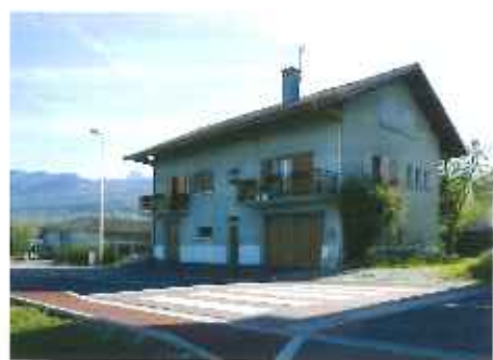
... qui est devenue ma demeure

A près un cours intermédiaire je rejoignis le conseil municipal. Plus tard de nouveau adjoint, j'ai participé à l'adhésion de la commune au syndicat d'assainissement en même temps qu'Evian et Publier.