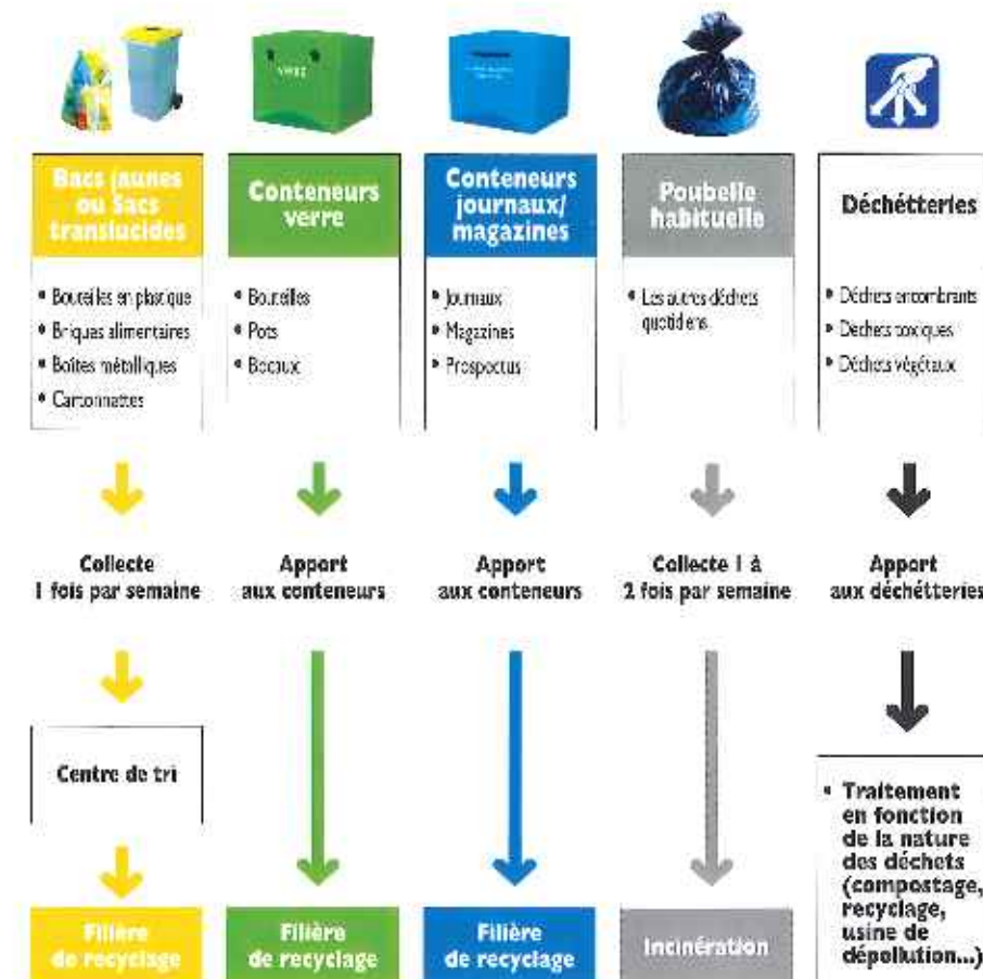
tableau de synthèse - zone urbaine