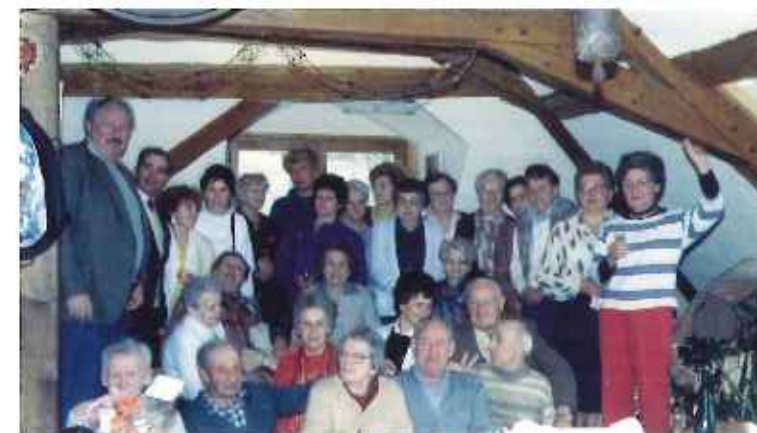
Premier repas en 1987 au Gîte Le Bois Ramé