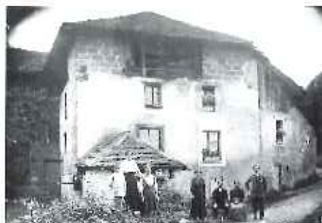
Le moulin vers 1920