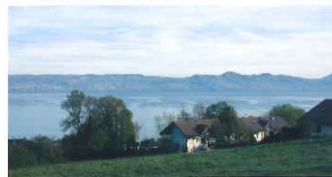
Cône de vue du cimetière

Le confortement des pôles donne une première assise. Elle permet également de pérenniser les équipements et les services nécessaires à la population et à l'économie et de créer des points d'échange et de mixité sociale en équilibre avec les quartiers plus résidentiels.