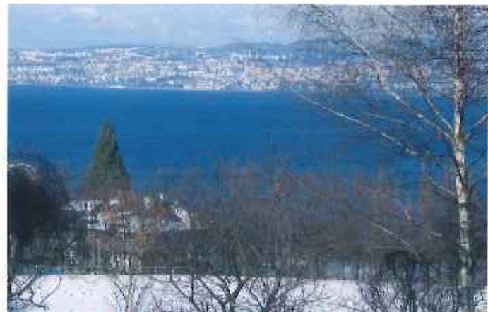
Cône de vue de la mairie

La dernière révision du PLU a permis de concrétiser et d'argumenter une image que nous avons tous en tête, qui nous semble tellement naturelle qu'elle prend des allures de carte postale figée et immuable.