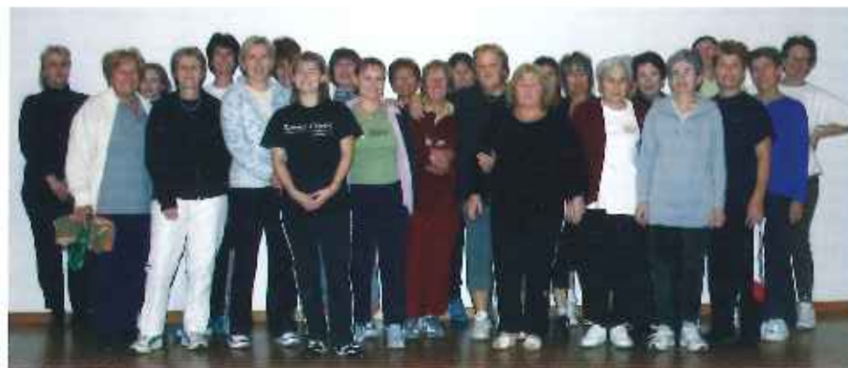
Repas à la Chapelle d'Abondance

205 avenue de Verlagny - 74500 Neuvecelle - Tél. 04.50.75.27.56