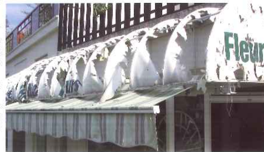
La cour..., la veille le 17 juillet 2005 à 11h.