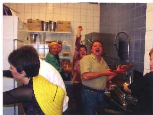
Ambiance asiatique & travail dans la bonne humeur !

La traditionnelle tombola a pu se dérouler, grâce aux généreux donateurs que l'on remercie chaleureusement. Les lots, tels des forfaits de ski, des entrées dans certains parcs d'attractions ou musées, ou encore des repas offerts dans certains restaurants d'Evian ont été appréciés.